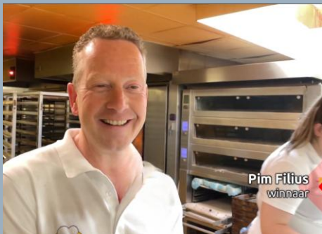
Zoon en bakker